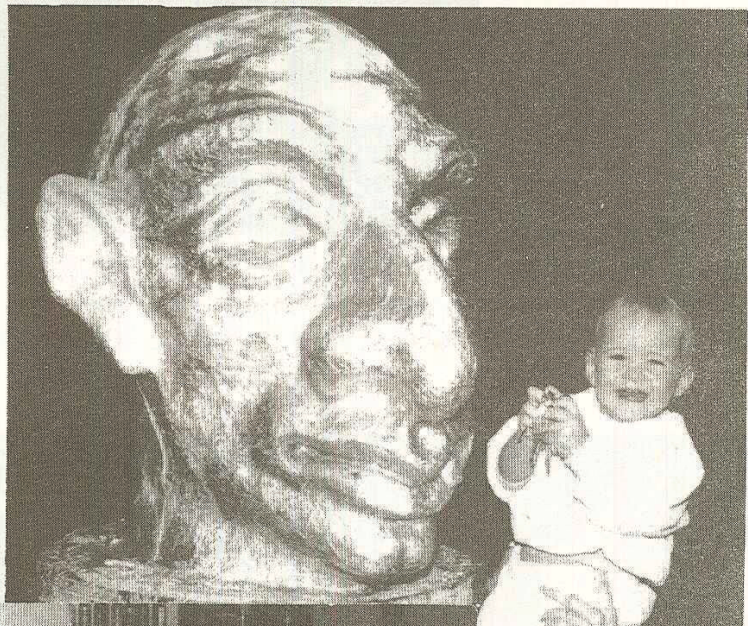
La Glorieta. no té por.

Reproducció reduïda del programa de la Trobada.