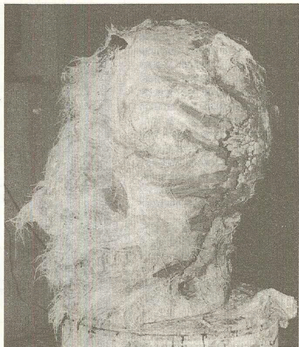
Fases de la gestació.