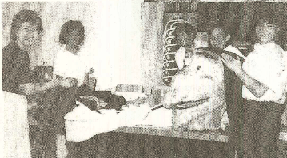
Les cosidores no s'atabalen.